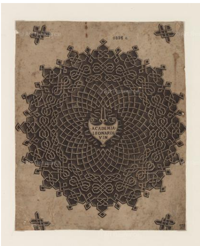
4. Ambito di Leonardo da Vinci Nodo (Achademia Leonardi Vinci) metà anni Novanta del XV secolo Incisione a bulino Milano, Veneranda Biblioteca Ambrosiana, Pinacoteca, inv. 9596E