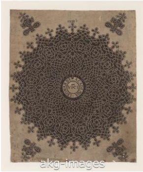
3. Ambito di Leonardo da Vinci Nodo (Achademia Leonardi Vinci) metà anni Novanta del XV secolo Incisione a bulino Milano, Veneranda Biblioteca Ambrosiana, Pinacoteca, inv. 9596B